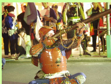
奥州伊達藩五葉山火縄銃鉄砲隊

岩手県住田町 奥州伊達藩五葉山火縄銃鉄砲隊伝承会 森林林業日本一の町づくりの紹介と木工団地視察など